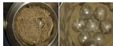
Aufbereitung von Zuckerrohrbagasse zur weiteren Probenanalytik

Im Januar 2016 wurde zudem der Pyrolyzer (Ofenaufsatz für GCMS) in Betrieb genommen. Dadurch können die Pyrolysegase online analysiert werden.